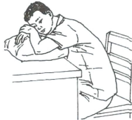
Fig. 9 Lateral prone sitting