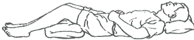
Fig. 4 Lying on the back