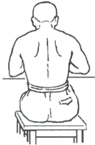
Fig. 8 Prone sitting