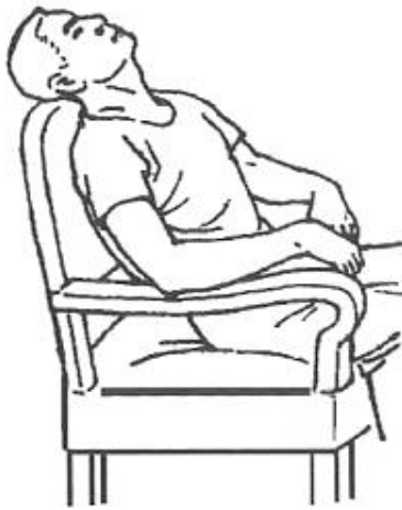
Fig. 7 Supine sitting