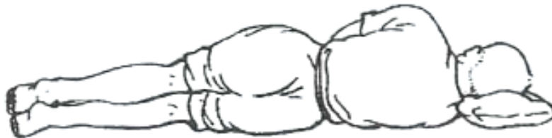
Fig. 5 Lying on the side