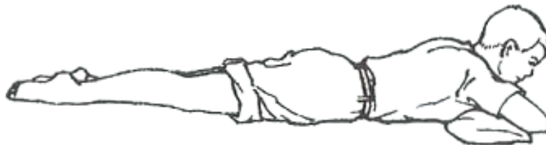
Fig. 6 Lying on the belly