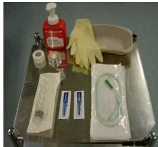
Gambar 1. Peralatan pemasangan NGT